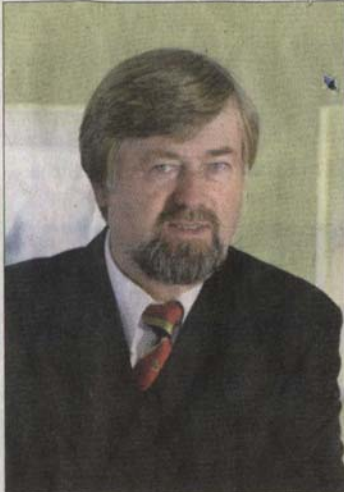
Paul Schneider gründete die Firma im 1979.